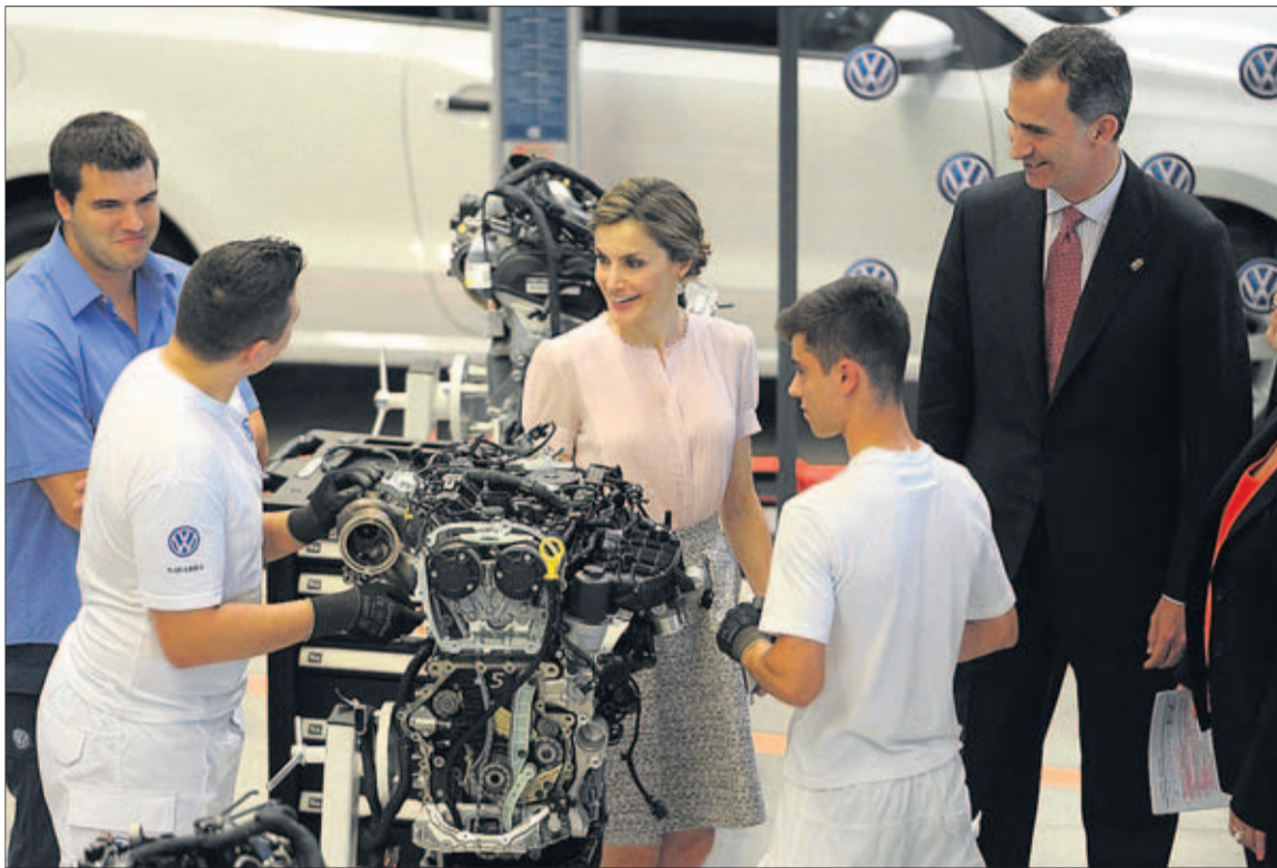
El rey Felipe VI y la reina Letizia, durante su visita a la planta navarra de Volkswagen con motivo de su 50 aniversario.

Según el comité de empresa de Landaben, este nuevo vehículo será un todocamino (SUV, por sus siglas en inglés). Estará basado en el modelo T-Cross Breeze, uno de los prototipos de futuros SUV de VW presentado hace unas semanas en Ginebra. La empresa aún no confirma este extremo. Solo detallan que "será de la familia del Polo y compartirá la plataforma de la sexta generación". Está previsto que la producción de la nueva generación del Polo empiece en 2017, del que ya se empezarán a realizar preserías a finales de año. En 2018, comenzarán con el otro automóvil.