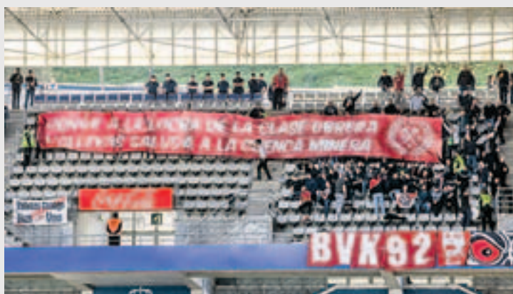
La pancarta que los aficionados del Rayo desplegaron en el partido del pasado domingo en el Carlos Tartiere.

gran pancarta de fondo rojo con el siguiente texto: “Honor a la lucha de la clase obrera. Vallekas (sic) saluda a la cuenca minera”. A la vista del éxito, los “bukaneros”, que así se denominan los hinchas franjirrojos, con fama de ser de extrema izquierda, se arrancaron a corear aquello de “que viva la lucha de la clase obrera”, pero en esa